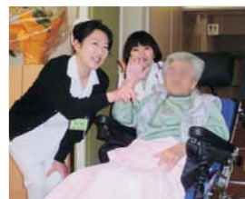
最初に入所された方