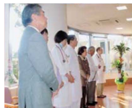
開所式（平成22年12月8日）