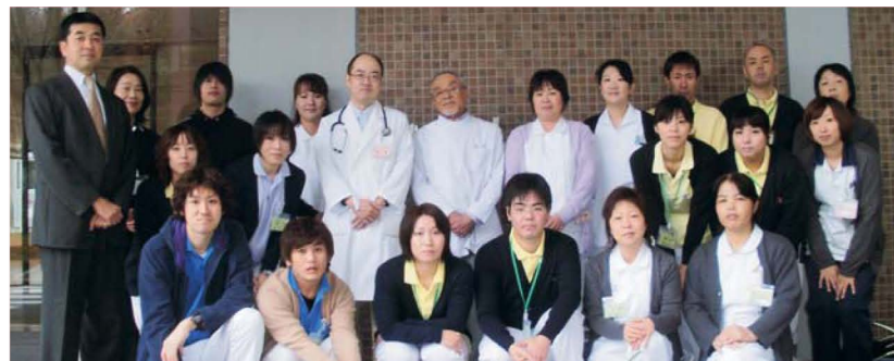
老健スタッフ一同